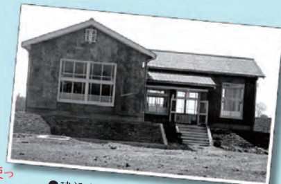
●建設当初の広瀬浄水場ポンプ室