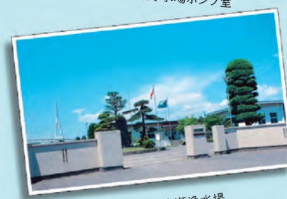
●現在の広瀬浄水場